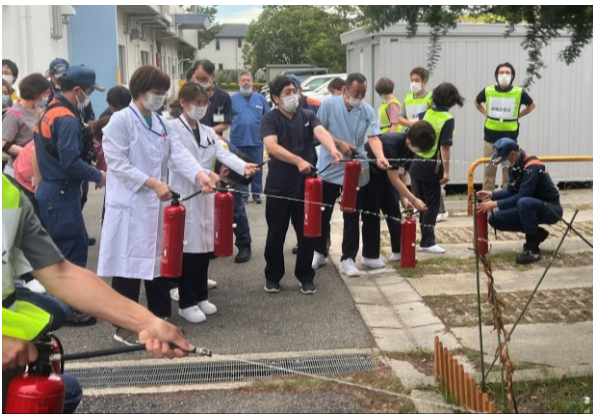
消火器での消火訓練