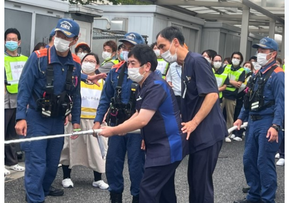
消火散水栓での消火訓練