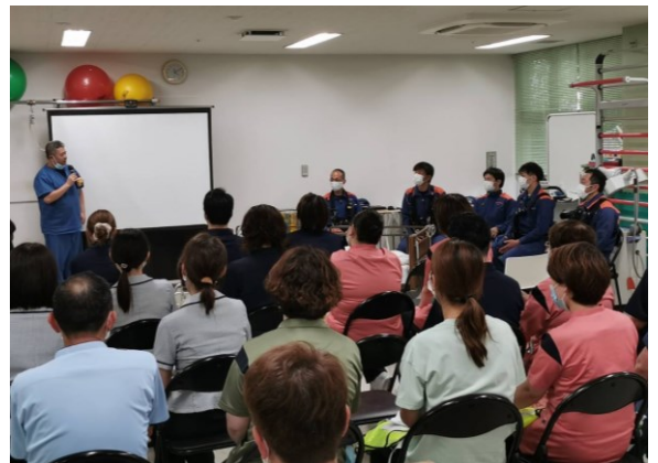
理事長による総評