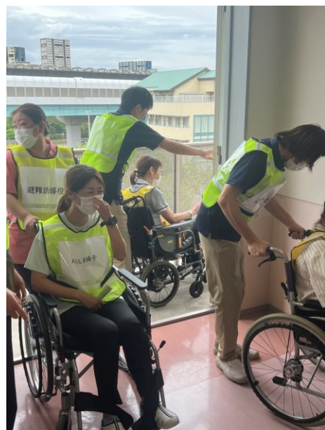
回廊へ避難している様子