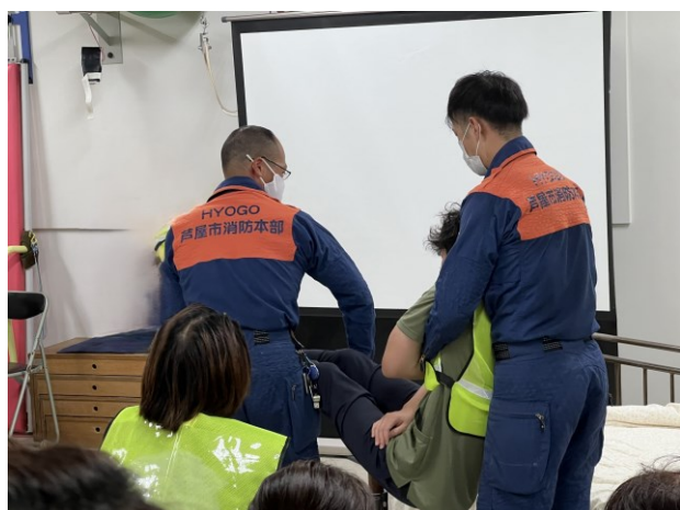
要救護者の搬送方法の実地訓練