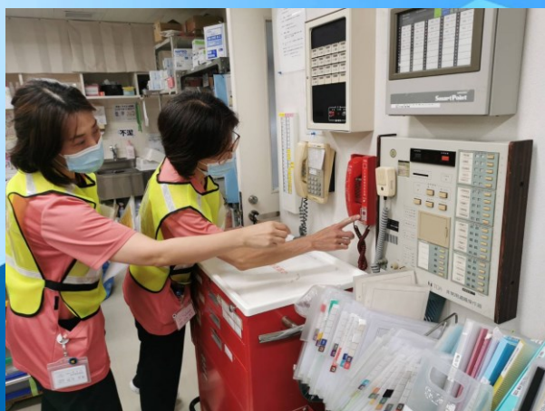
通報しようとしている様子